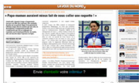
Aperçu ( /user/acces-ereader )