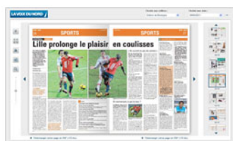
Aperçu ( https://abonnement.lavoix.com/numerique/produit/liseuse/vdn/ )