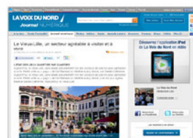
Aperçu ( /journal-numerique#journal-numerique-ancre-sommaire )

http://memorix.sdv.fr/5c/www.lavoixdunord.fr/num/infoslocales/lill_articles/156632909/Bottom1/default/empty.gif/574b4239766b396f396455414476644d