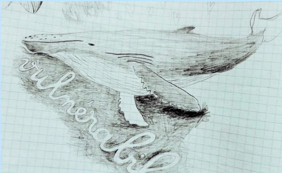
Dessin : Mariane Berthault